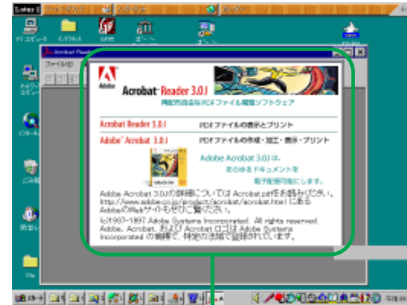
起動中メッセージ